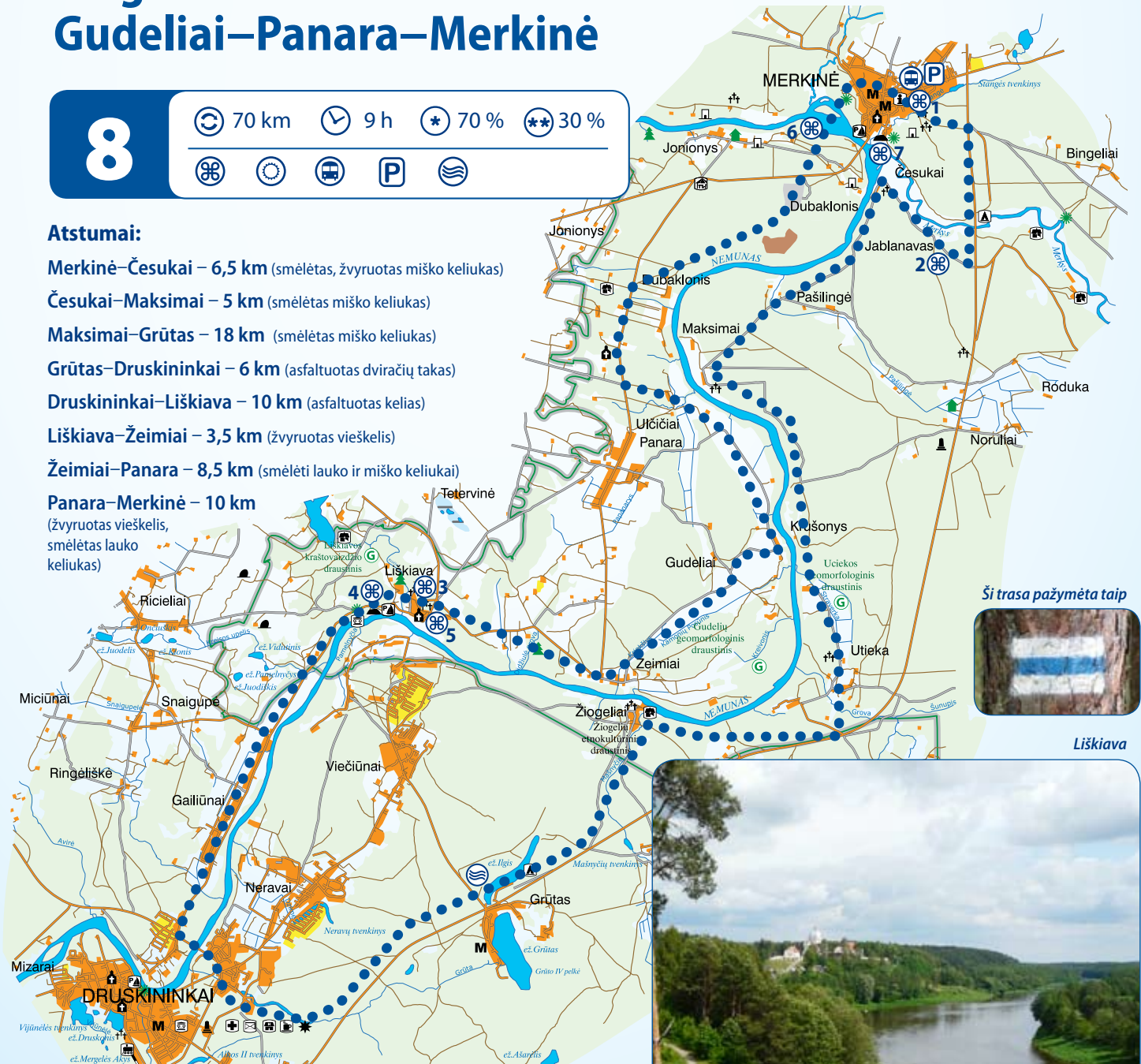
Ši trasa pažymėta taip